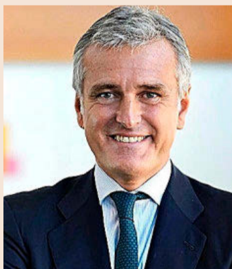
El presidente de PwC, Gonzalo Sánchez.

PwC se anotó en su último ejercicio, desde el 1 de julio de 2024 hasta el 30 de junio de 2025, un crecimiento del 8,9% de sus ingresos, por debajo del 11,7% del ejercicio precedente. En el reporte de sus datos para este análisis, la firma incluye la actividad de negocio que realiza en el exterior en empresas españolas y que gestionan sus socios y equipos nacionales, cuya cuantía no separa ni detalla, por lo que no es comparable con lo reportado por sus competidores, que se ciñen a los resultados disponibles en el Registro Mercantil. Teniendo en cuenta esto, PwC cerró el periodo con unos ingresos de 981 millones de euros, destacando en el área de auditoría, que elevó su facturación un 9,7%, hasta los 422 millones de euros. PwC, que en el último ejercicio se convirtió en la nueva auditora de Moeve (relevando a Deloitte para los ejercicios 2025, 2026, 2027 y 2028), cuenta entre